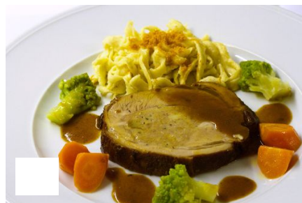
Gefüllte Kalbsbrust mit Spätzle oder Gemüsestrudel